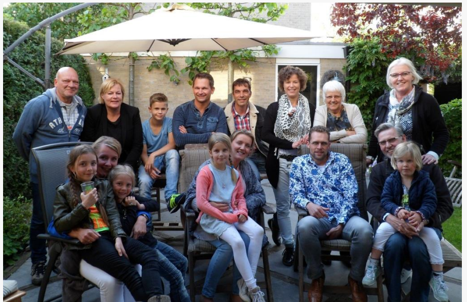
Uitgenodigd bij de afsluitende barbecue van een kring in de Regenboog

We genieten van Gods goedheid, juist als gezin!