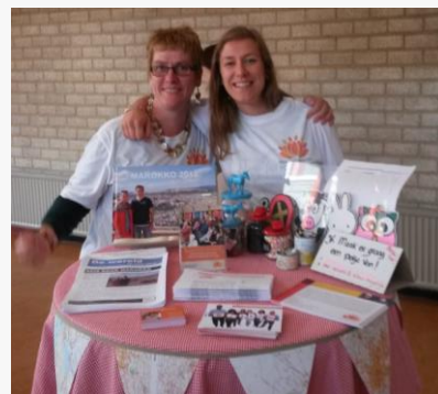
Het ABC op de zondagsavond

Inmiddels komt deze broeder in ICF. We hopen en bidden dat zijn gezin snel kan overkomen.