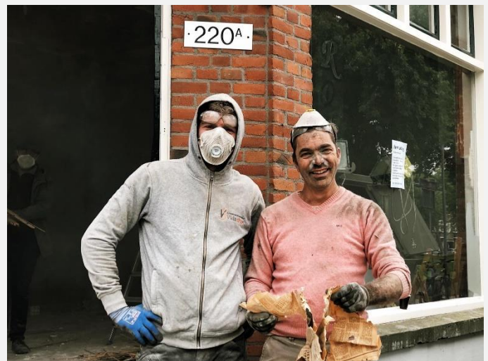
Van slopen wordt je grijs – voor de deur van BLEND

Zijn voorstel: "Stuur me de tekeningen toe en kom morgen even terug". Zo gezegd, zo gedaan. We zijn enorm benieuwd.