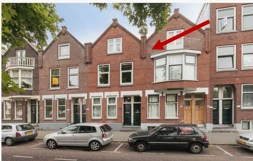
Het middelste huis: onze nieuwe woning aan de Lange Hilleweg

De Heer zei: Ben Ik het niet die de sterren hun plaats heeft gegeven? Ben Ik het niet die ze bij naam kent? Ik voelde me beschaamd. Ik weet dat God bij machte is om oneindig veel meer te doen dan ik bid en besef, maar het doorleven in zo'n proces maakte het water voelbaar onder mijn voeten. Zijn stem gaf rust; ik wist dat Hij het zou gaan doen en ervoer zo'n diepe, gunnende liefde. Hoe kan het ook anders? Hij is mijn Vader die honderd keer beter voor mij zorgt dan ik voor onze kinderen.